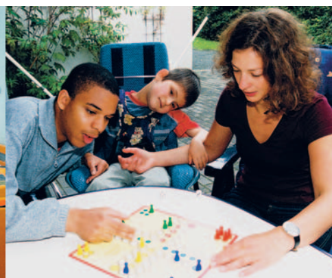
Mit Hilfe der Betreuer kann die Freizeit individuell gestaltet werden. Spaß und Spiel gehören dazu.