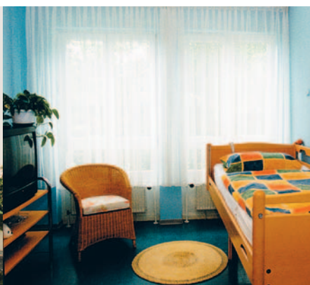
Die großzügigen Einzel- und Doppelzimmer sind hell und freundlich eingerichtet.