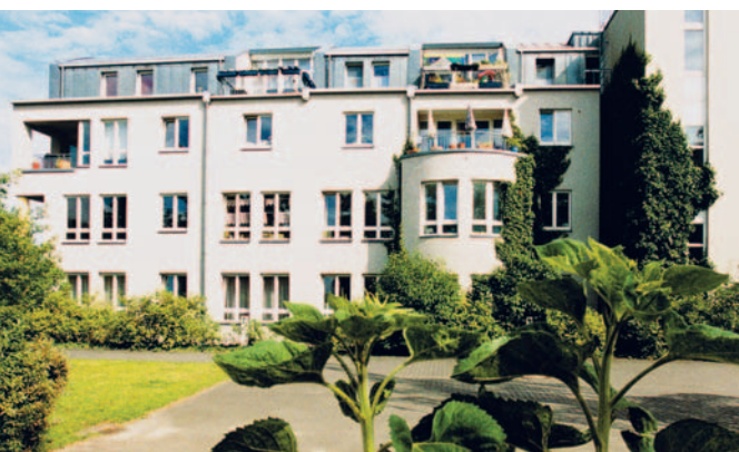
Die Herberge befindet sich im Erdgeschoss dieses modernen Wohnhauses in Berlin-Lichterfelde. Der dazugehörige Garten wird gern genutzt.

Wir freuen uns über Ihr Interesse an unseren Einrichtungen und Angeboten. Gerne informieren wir Sie in einem persönlichen Gespräch vor Ort. Bitte vereinbaren Sie mit uns einen Beratungs- oder Besichtigungstermin.